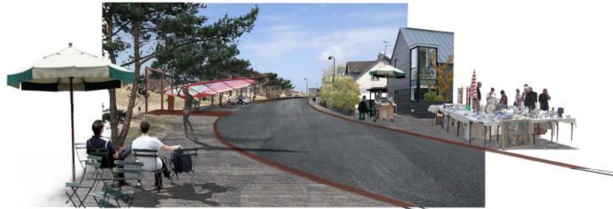
Visualisering af ny Øresundsvej - byens møde med havet