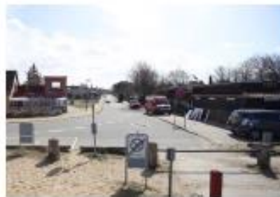
AR Friisvej - ankomsten til stranden