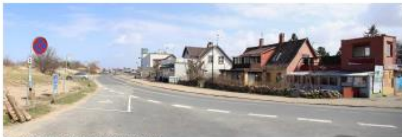
Øresundsvej - byens møde med havet