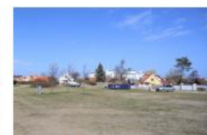
Byen og stejlepladsen