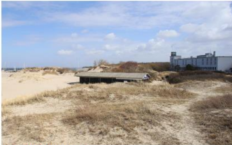
Lystbådehavn, strand og markant bygning

Naturen, havnen og det lokale værtskab er tre væsentlige styrker, når det handler om at tiltrække turister til Horbæk. Badning finder sted både sommer og vinter og havnen er blevet et vigtigt knudepunkt for sejlads og maritime oplevelser. Netop det maritime tema, som har bred opbakning blandt borgere og sommerhusejere i Horbæk er oplagt at arbejde videre med i forhold til at udvikle flere aktiviteter, oplevelser, events og steder, der kan understøtte temaet, lige så vel som de nye spirende oplevelser og aktiviteter inden for wellnessområdet, vil være med til at gøre Horbæk attraktiv for high end turismen. Horbæk har dog en udfordring i forhold til at kunne indfri det købestærke turismesegments behov, som efterspørger kvalitet og god service inden for bespisning og shopping. Behovet kunne indfries med en kvalitetsrestaurant på havnen og nogle pop up butikker i højsæsonen. En stor styrke er det lokale værtskab. Værtskabet ligger i en uformel omgang blandt de lokale og turisterne. Værtskabet kunne synliggøres og styrkes endnu mere ved udpegning af lokale ambassadører og turistguides i højsæsonen, der kan være med til at formidle Horbæks historie til turister eller blot vise vej til de gode oplevelser.