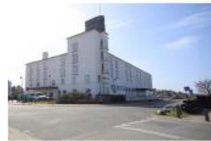
Overgang mellem by og havn