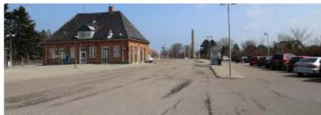
Den øde stationsplads