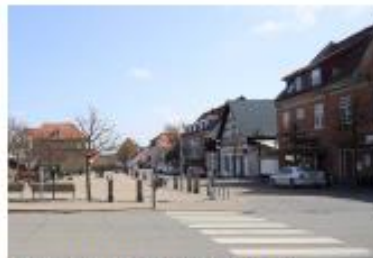
Torvet med gennemkørende trafik

Ved stationen ligger vej og jernbane højt i landskabet og gennemskærer byen i øst vestlig retning. Nyere infrastruktur med brede vejtrasser gennemskærer byen og er med til at ændre byens karakter fra fiskerby/landsby til provinsby.