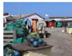
Haven - som erhverv