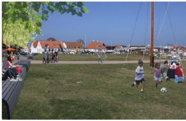
Visualisering af ny grønning