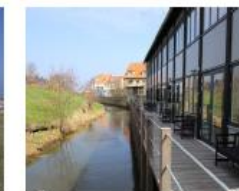
Åen som løber ned gennem byen