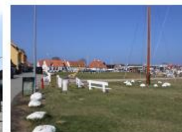
Bykanten ud mod havnen