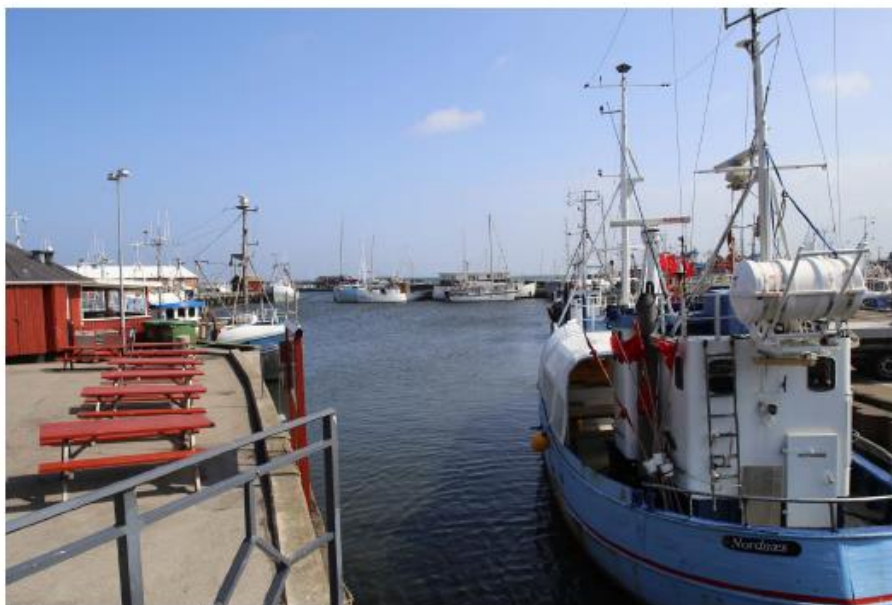
Helårsbyen med handelsliv og aktiv fiskerihavn

Havnemiljøet rummer en række turismemæssige potentialer, som kan indfries ved at gøre havnen mere tilgængelig og invitere til ophold på havnen. Der skal arbejdes med den fysiske såvel som mentale tilgængelighed, i form af aktiviteter og formidling, der kan gøre havnen attraktiv som turistmål. Lige såvel bør Gilleleje arbejde med byens værtskab og derigennem sikre, at turisterne føler sig velkomne, får lyst til at blive lidt længere og kan finde vej til byens muligheder og oplevelsesudbud.