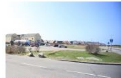
Infrastruktur som gennemskærer bykernen