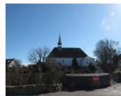
Kirken og landsbyen